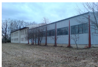
Hala praxe a odborného výcviku Nový Dvůr