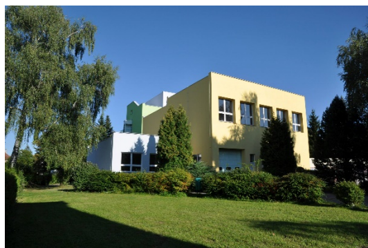
a areál školy