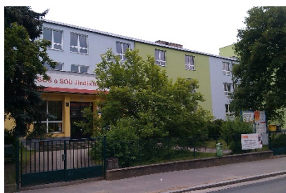
Budova školy Jáchymova 478