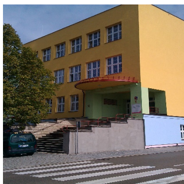
Budova školy Miřiovského 678