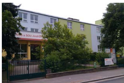
Budova školy Jáchymova 478