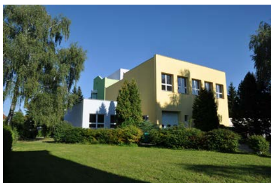
a areál školy