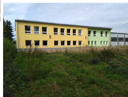
Hala praxe a odborného výcviku Nový Dvůr