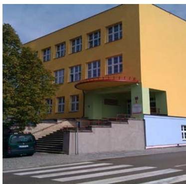
Budova školy Miřiovského