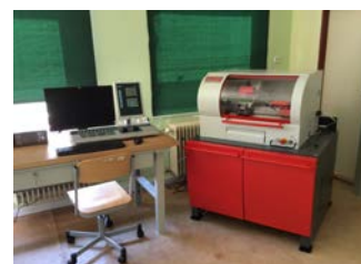
Hala odborného výcviku