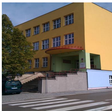
Budova školy Miřovského