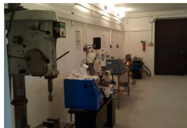
Hala odborného výcviku