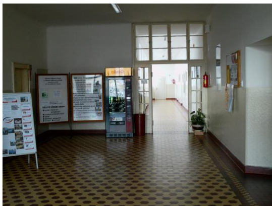
Budovu SOU, Miřiovského 678