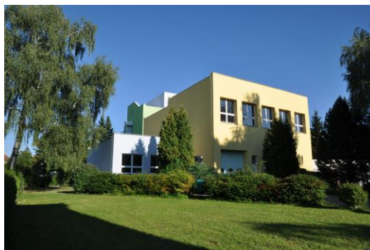
a areál školy